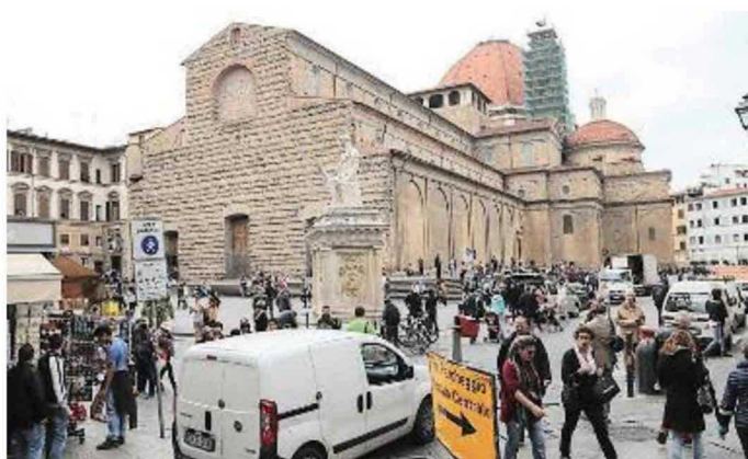
Una veduta di piazza San Lorenzo con la parte laterale liberata dai banchi degli ambulanti

Sempre validi i consigli contro il caldo che sono a disposizione sul sito della protezione civile. Il numero da chiamare è il 800508286 il lunedì, il martedì, il mercoledì e venerdì dalle 9 alle 13.