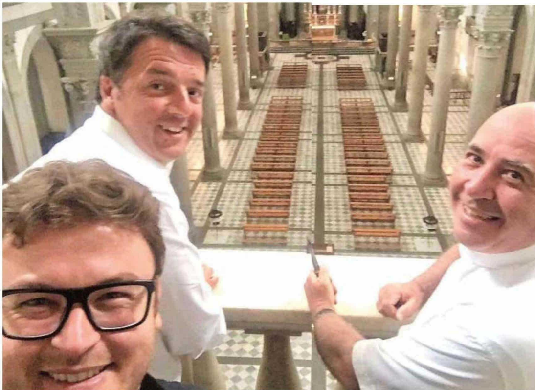
La foto postata su Facebook dall'ex premier Matteo Renzi insieme a don Gabriele e a monsignor Marco Viola. «Matteo Renzi - ha detto il parroco - ha voluto vedere i pulpiti di Donatello e godersi la Basilica»