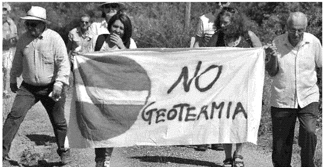
ALTA TENSIONE Una manifestazione contro la geotermia nella zona dell'Amiata