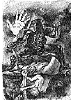
Sopra «Il sonno della ragione genera mostri» di Renato Guttuso, realizzato nel 1980. A destra, «Il pensatore» di Giorgio De Chirico del 1973