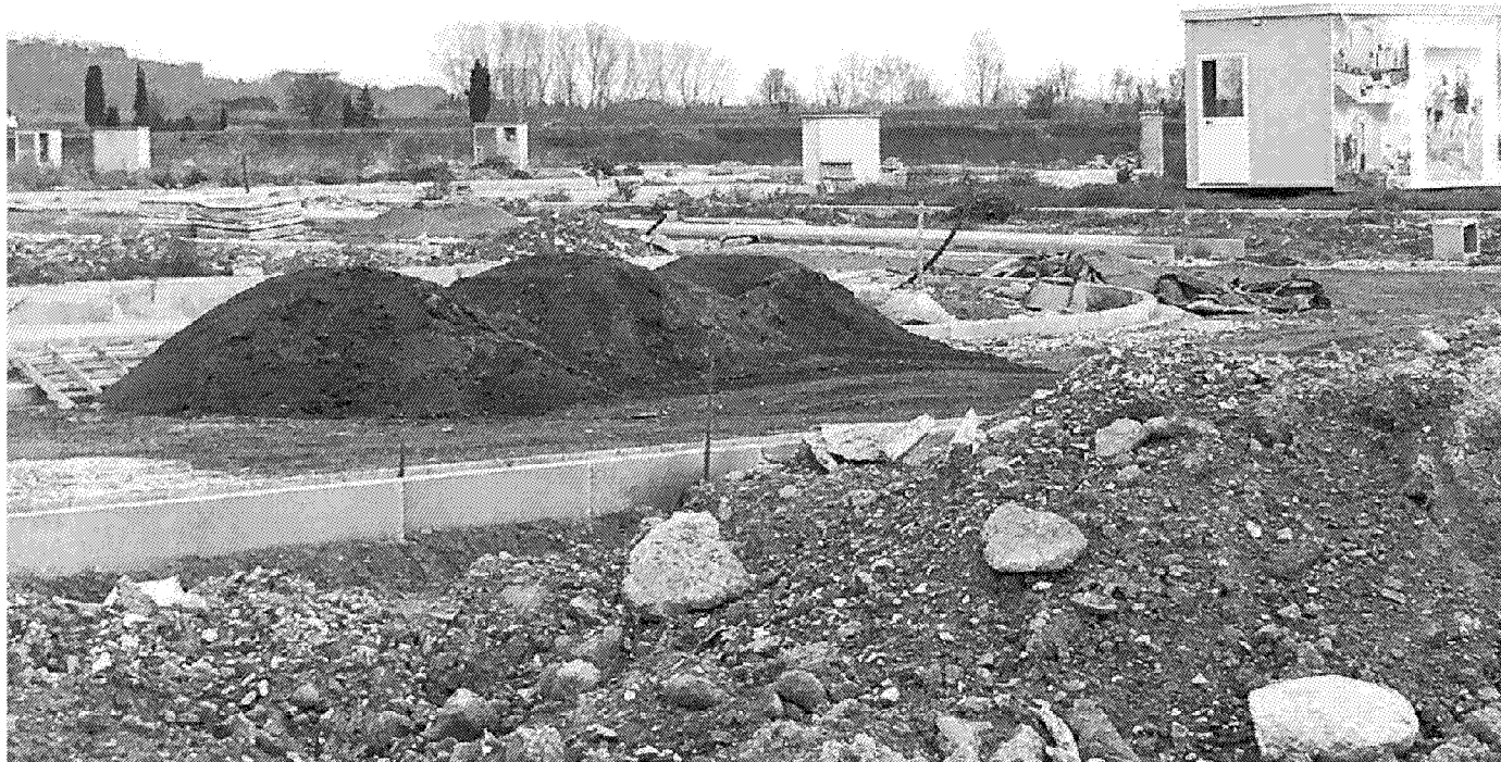
I cumuli di terra nel mirino dell'Arpat