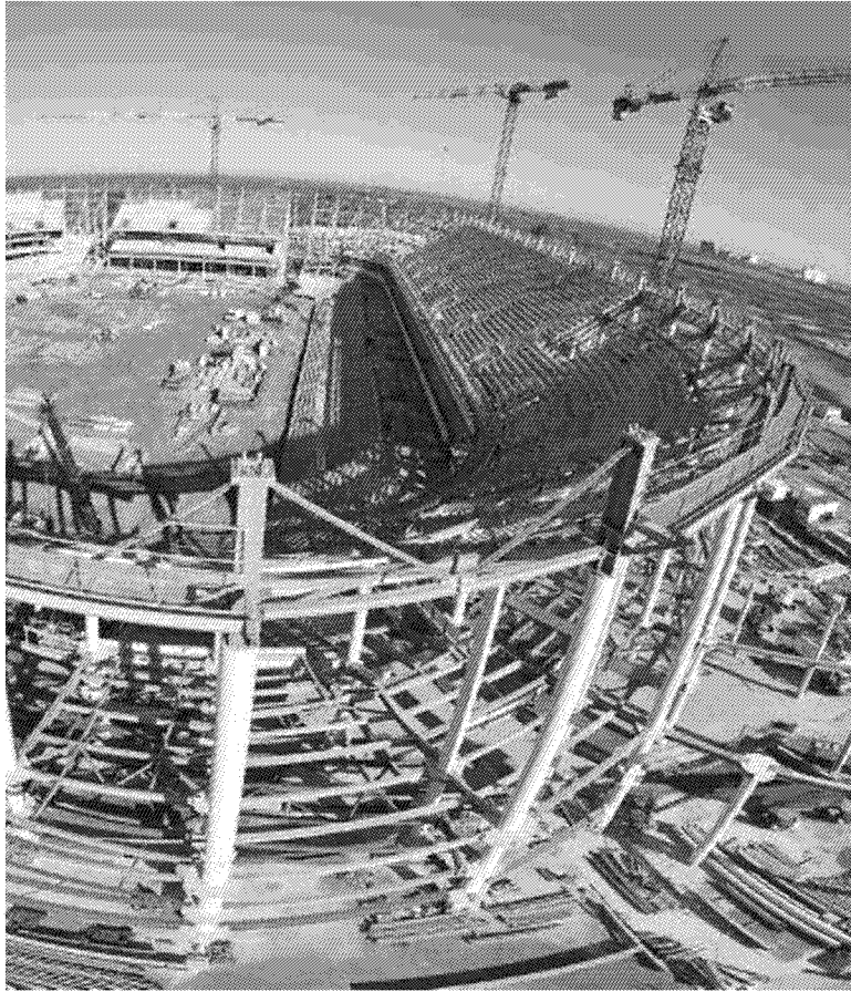
Lo stadio Matmut-Atlantique di Bordeaux è stato costruito per ospitare l'Europeo di calcio 2016: con una capienza di circa 42mila posti a sedere. Lo stadio, qui nelle fasi di costruzione, è stato realizzato in due anni e mezzo ed è costato 168 milioni di euro