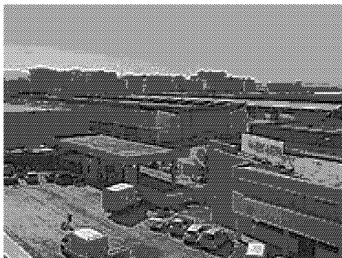
La Mercafir, vista dal tetto degli uffici del mercato