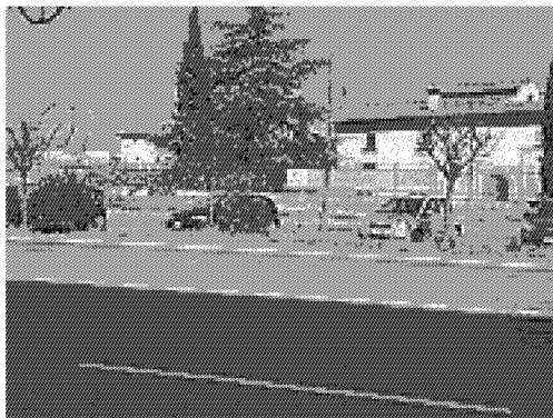
La biblioteca, separata dal quartiere da viale Guidoni