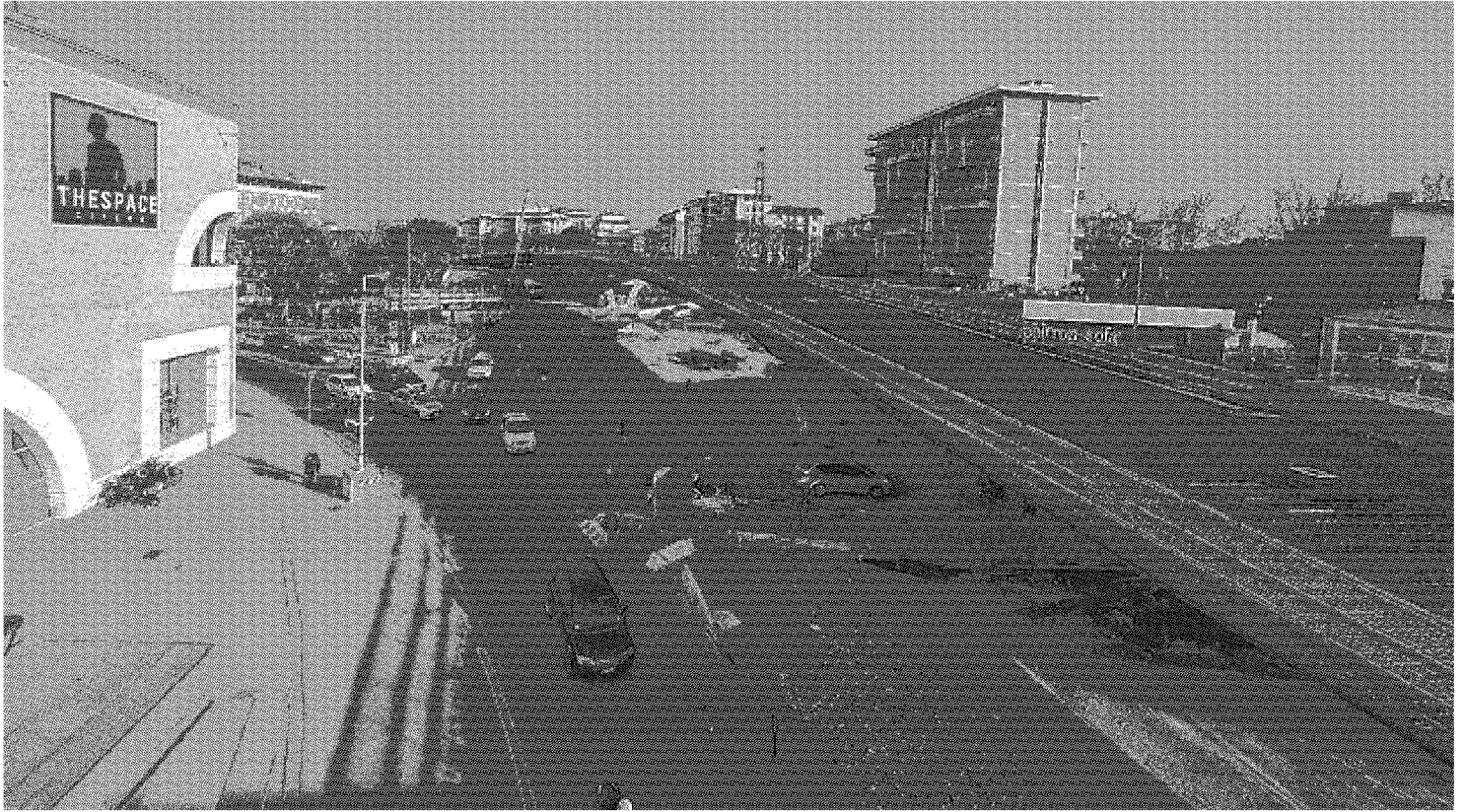
Il viadotto della linea 2 della tramvia Stazione aeroporto su via di Novoli. In gran parte già costruito, scende all'altezza di via Circondaria e supera così Mugnone e Terzolle. Parte da circa metà di via di Novoli