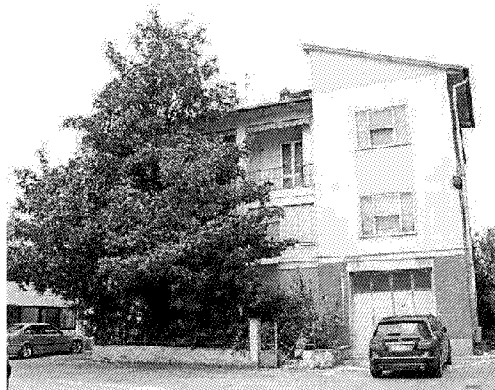
A sinistra l'immobile che in passato ospitava la concessionari Finocchi in via Savonarola