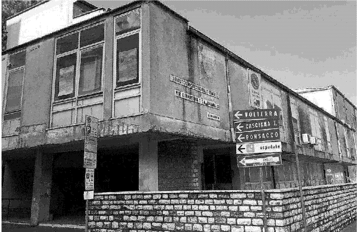
L'ex Ipsia di Pontedera e a destra dall'alto la fonderia Ceccanti a La Rotta, lo scalo merci alla stazione e il palazzo ex Enel