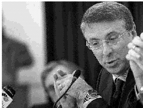
Raffaele Cantone presiede l'autorità Anti-corruzione