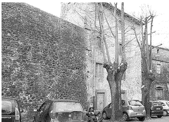
Le mura medicee di Fivizzano