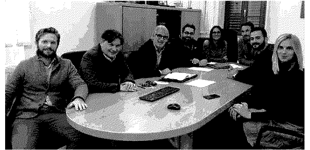
GIUNTA La squadra di governo di Orbetello si riunisce oggi per decidere la linea da seguire sull'autostrada