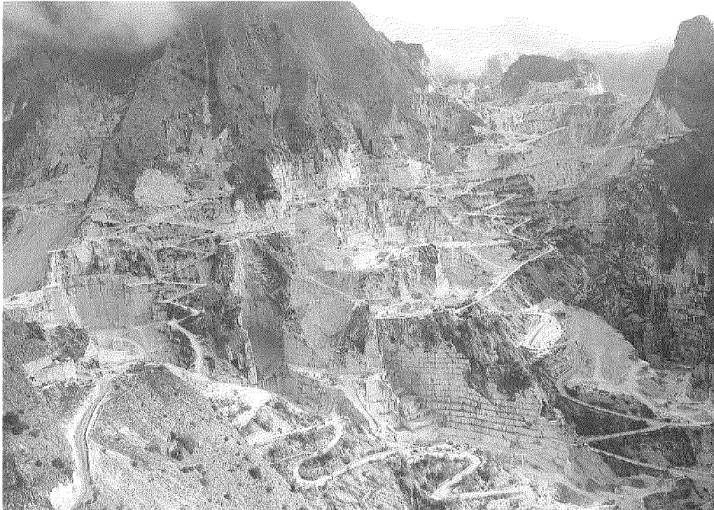
Uno scorcio delle cave