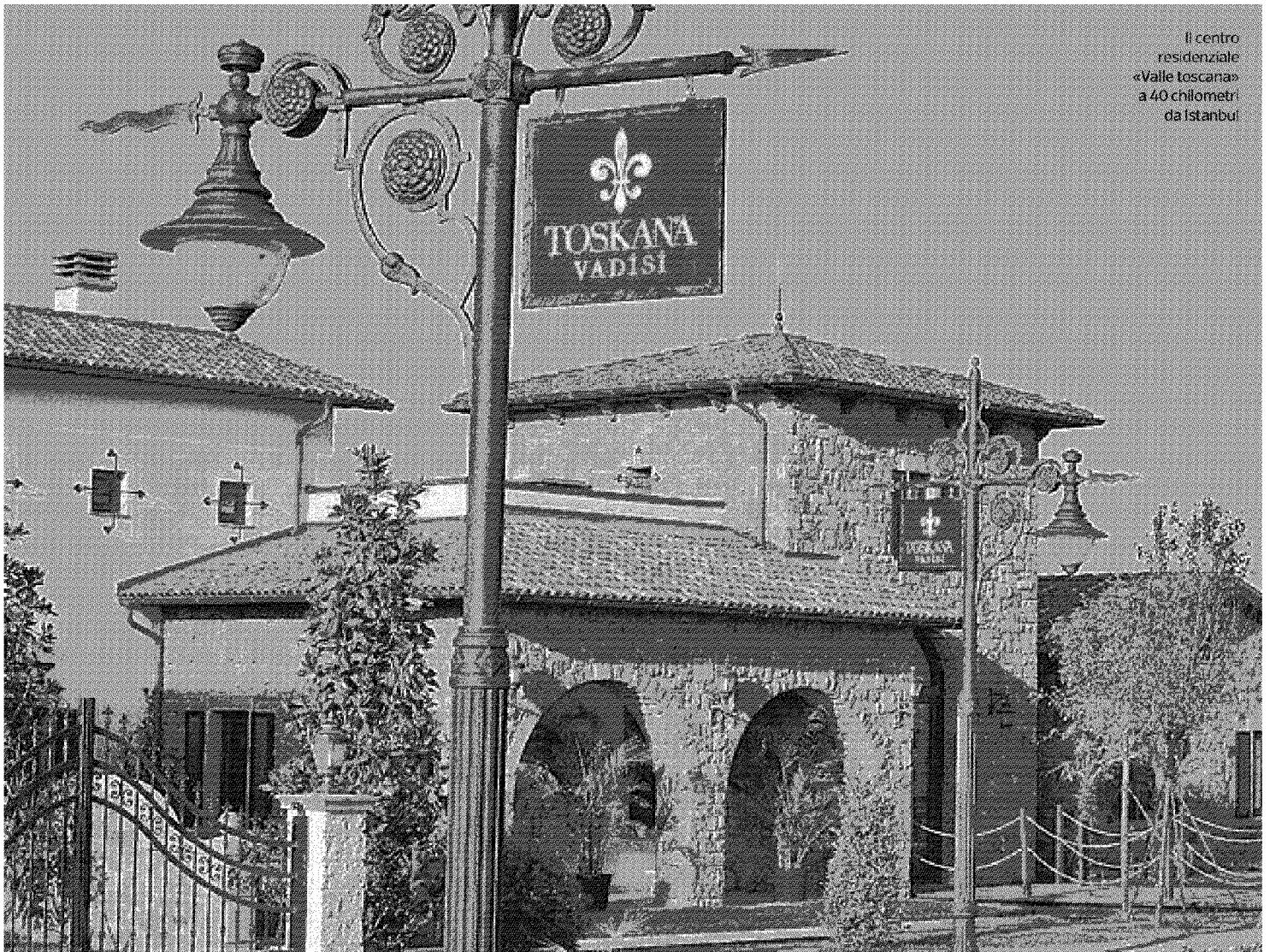
Il centro residenziale «Valle Toscana» a 40 chilometri da Istanbul