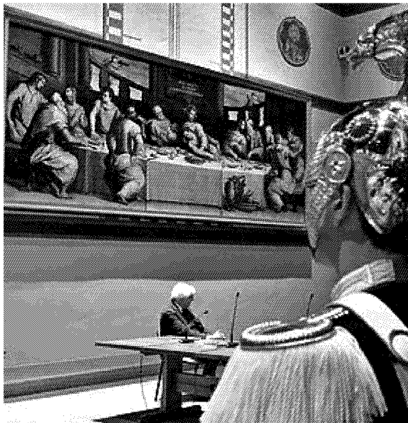
L'Ultima Cena del Vasari nella nuova collocazione in Santa Croce