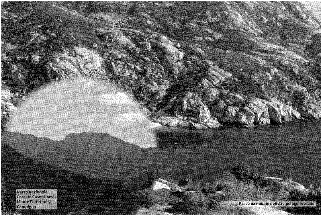
Parco nazionale Foreste Casentinesi, Monte Falterona, Campigna

anche sul fatto che questa riforma sia «sbagliata». Anche sul tema delle riserve naturali. Avevano infatti presentato emendamenti al Senato dove chiedevano che le riserve venissero gestite dagli enti parco, «ma non sono stati nemmeno presi in considerazione - dice ancora il Wwf - senza nemmeno darci una spiegazione chiara sul perché. Noi riteniamo che sia una grande semplificazione inserire le riserve nella gestione degli enti parco».