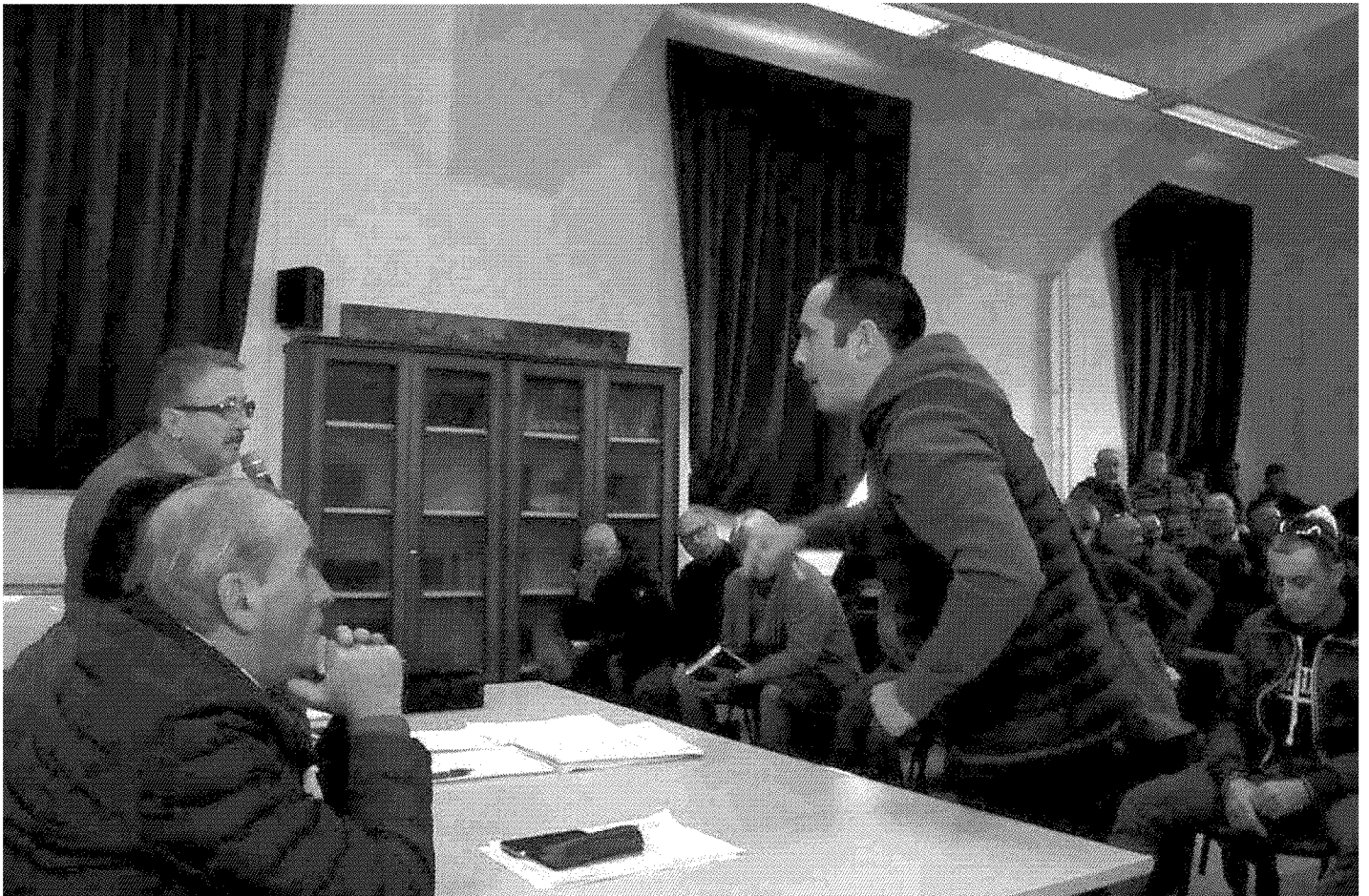
Un momento del confronto tra il tavolo sindacale e la Lega dei cavaatori