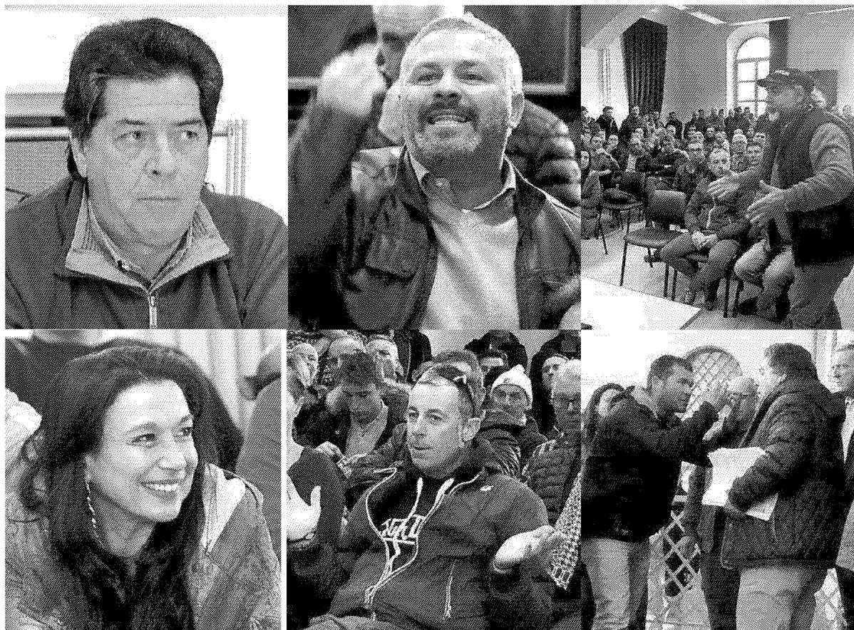
Alcuni momenti dell'assemblea alla biblioteca di Carrara

Faticosa intesa sul documento congiunto sulla cassa integrazione