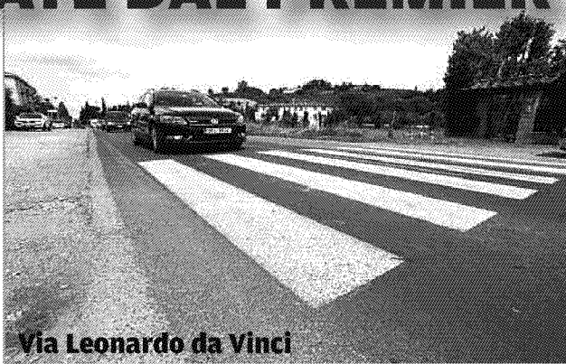
Via Leonardo da Vinci