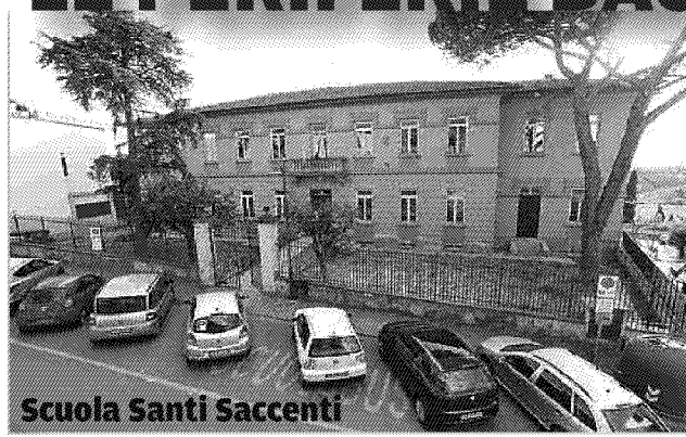
Scuola Santi Saccenti