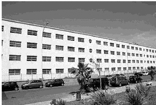
TORINO La struttura fu costruita tra il 1936 e il 1938 a Marina di Massa. Ospitava fino a mille bambini piemontesi. E' stato trasformato in ostello e oggi senza una destinazione