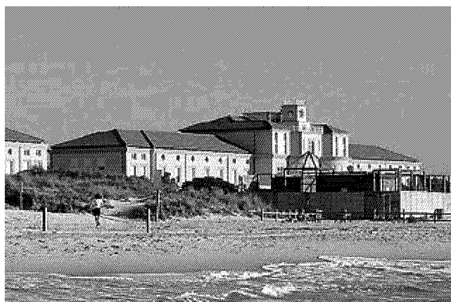
REGINA ELENA L'ex colonia, enorme edificio sul litorale pisano, fu inaugurata nel 1933. Oggi è il moderno complesso turistico «Regina del mare»