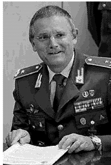
A lato un momento delle indagini 'sul campo'. Sopra il generale di brigata Benedetto Lipari, comandante provinciale di Firenze della Guardia di finanza