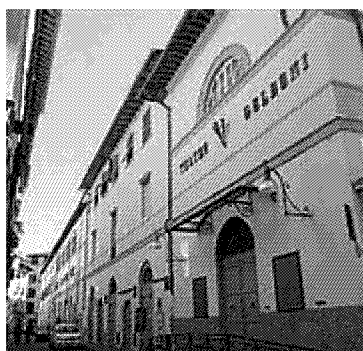
L'ingresso del Teatro Goldoni in via Santa Maria

Oggi la platea ha 143 posti, i palchi 178. Ci sono la Sala Verde del pianoterra e la Buvette al primo piano: spazi ideali per ricevimenti da 80-100 persone