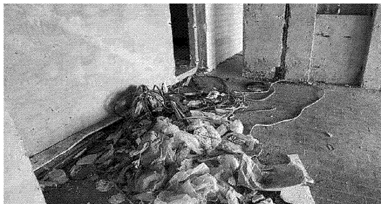
Sopra l'ex albergo a confine con il comune di Carmignano e accanto eternit lasciato nel verde