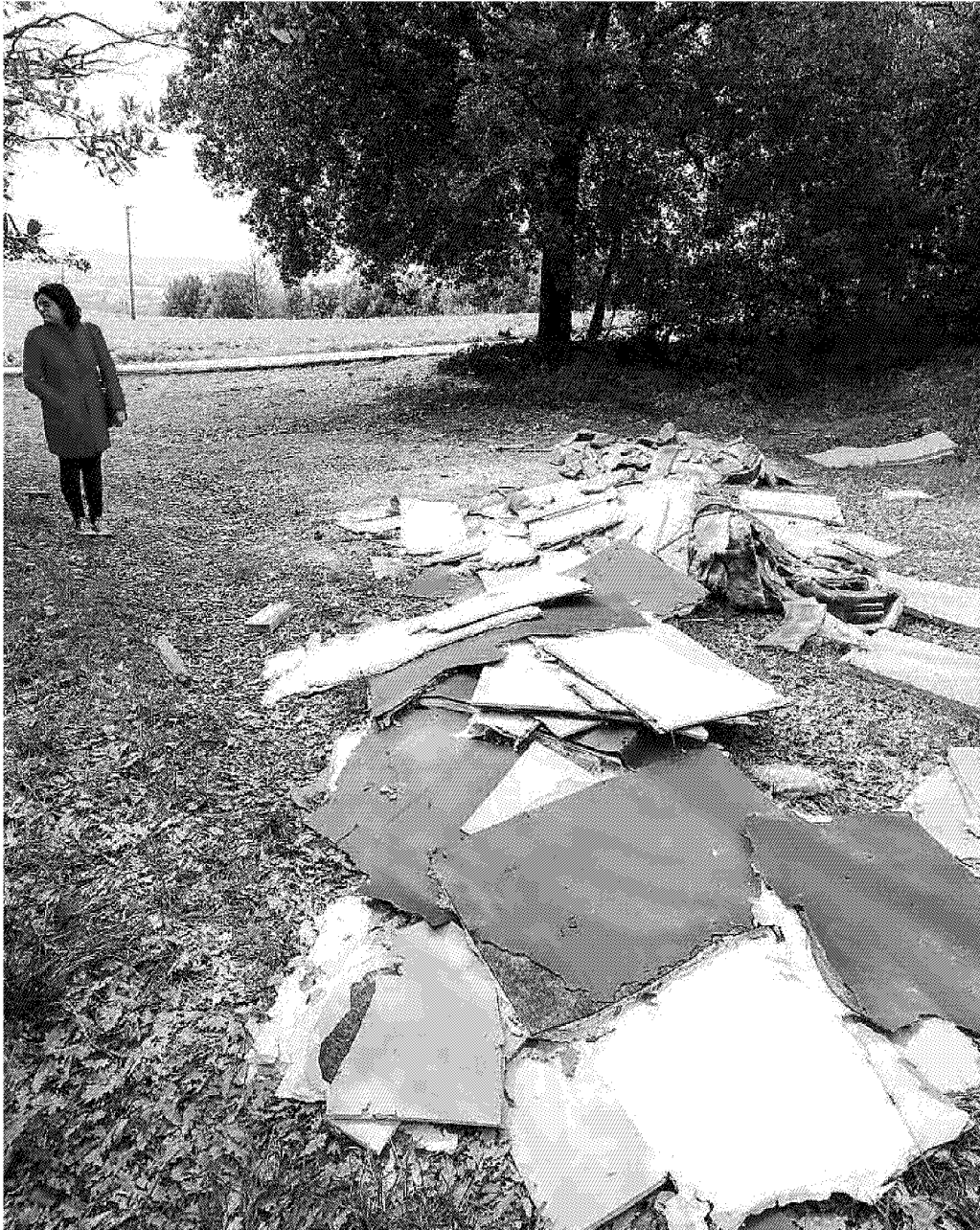
L'abbandono vicino a Castra