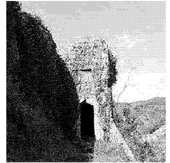
Una vista della Rocca