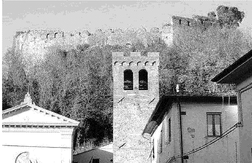
La Rocca di San Giuliano sarà studiata dalla Bocconi: converrà restaurarla?