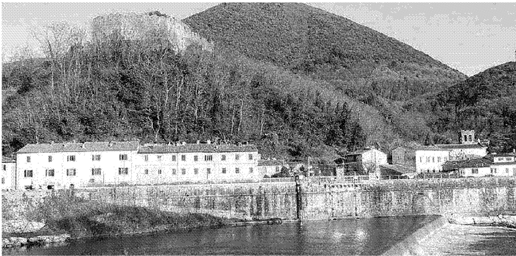
Anche la frazione di Ripafratta potrebbe avere dei benefici