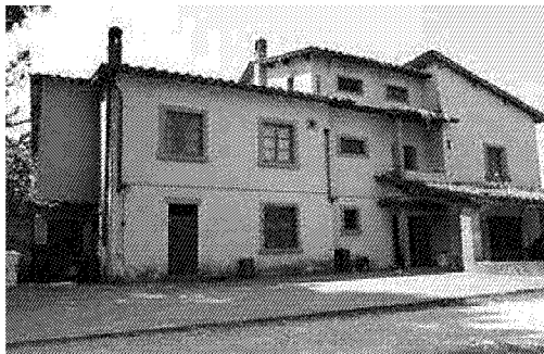
L'azienda agricola di Galleno