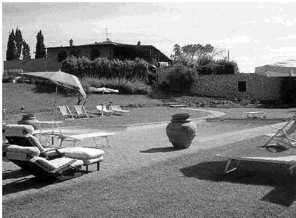
La Tenuta di Pomine in mezzo alla campagna certaldese