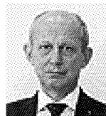
Regione Stefano Ciuoffo

istituita di nuovo con un decreto legislativo nel 2011 . La cifra da pagare varia in relazione al livello della struttura in cui si alloggia, fino a un massimo di 5 euro a notte