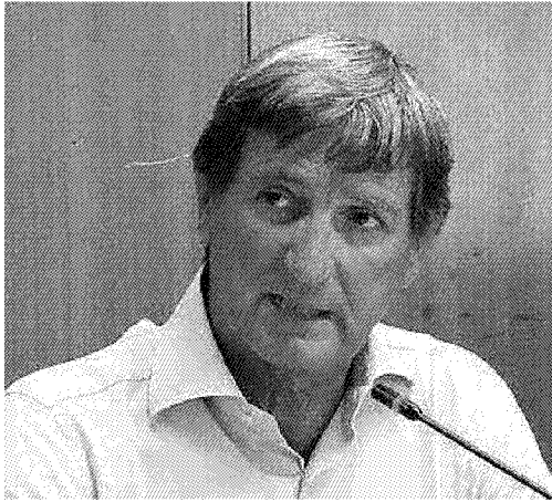
Il sindaco di Carrara Angelo Zubbani