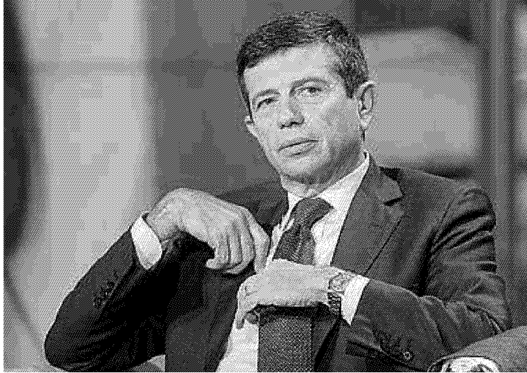
Il ministro dei Trasporti e delle Infrastrutture, Maurizio Lupi garantisce che il governo sarà sempre più a fianco del Vespucci