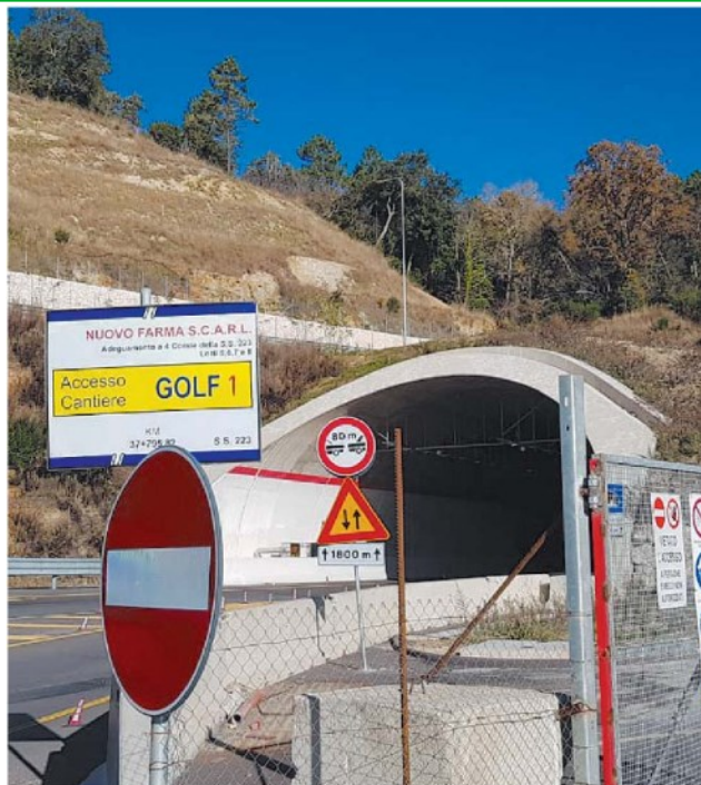
Svolta C' è il progetto per l'ammodernamento della galleria di Casal di Pari. I lavori nel vecchio tunnel attualmente fuori uso costeranno 25 milioni.