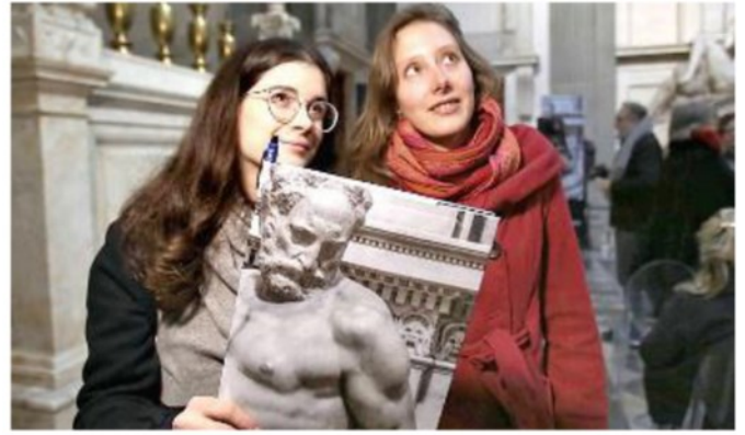
Nuova illuminazione nella stanza segreta di Michelangelo