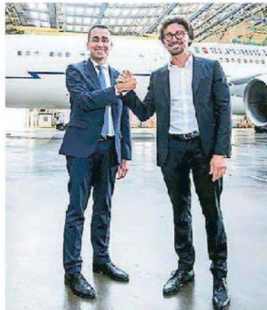
I ministri Di Maio e Toninelli

succede a caso, secondo un sondaggio piovuto sul tavolo dei vertici e degli strateghi del M5S, l'Ilva, il Tav e la Tap potrebbero costare una buona fetta di consenso. / ALLE PAG. 2-3