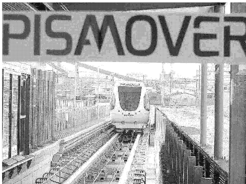
Il People Mover