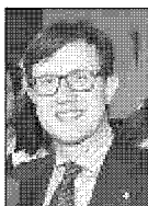
DARIO NARDELLA Sindaco Firenze

«Se tutto va bene la nuova pista dell'aeroporto Vespucci potrà essere realizzata per la primavera del 2020»