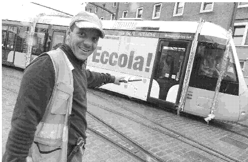
Sono in tutto 29 i nuovi tram Sirio che entreranno in servizio sulle linee 2 e 3 della tramvia

Domani, per habitué e curiosi, i test proseguiranno tra Careggi e piazza dell'Unità Italiana e tra Careggi e Valfonda. Da Palazzo Vecchio intanto arriva una buona notizia. «Da oggi – annunciano – partiranno i lavori di asfaltatura sulla linea 3 in viale Morgagni: sarà chiuso il tratto da piazza Dalmazia a via Cesalpino. Si invitano i cittadini – concludono dal Comune – a non lasciare i veicoli in sosta sulla sede tramviaria. In caso contrario scatteranno, come già accaduto, multe e rimozioni con il carro attrezzi».