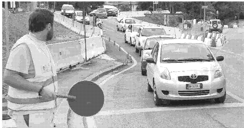
Il Comune di San Giovanni chiede interventi sulla viabilità esterna per la terza corsia dell'Autosole