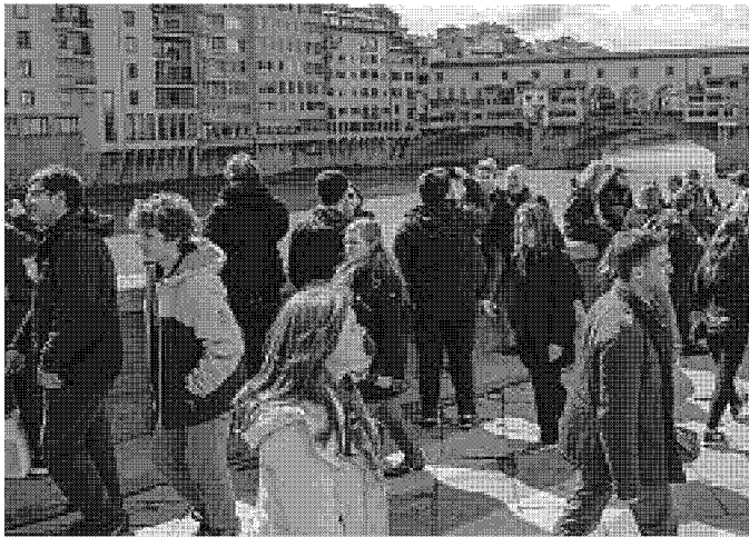
L'assalto dei turisti sul lungarno davanti agli Uffizi

Previsioni da record per la Toscana: novanta milioni di presenze attese nel 2018