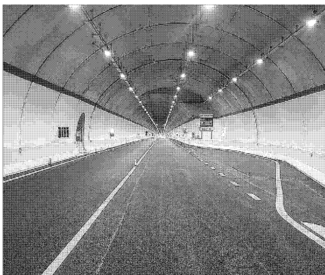
La nuova galleria ieri l'apertura. Il vecchio tunnel sarà ristrutturato