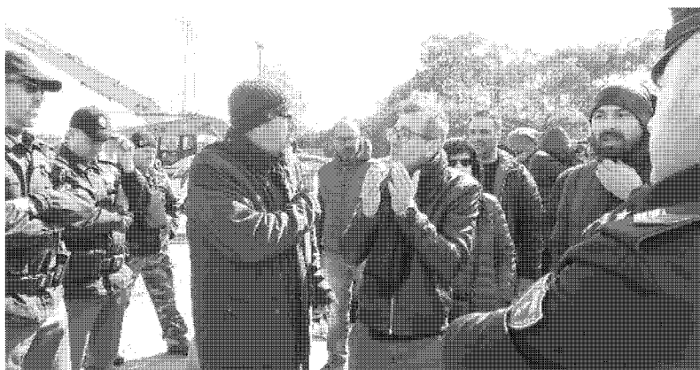
CONFRONTO I lavoratori di Rimateria parlano con polizia e carabinieri al momento del sequestro

Ora, l'auspicio da parte di tutti, è che si facciano gli interventi necessari per la captazione del biogas e tutte le operazioni per la messa a norma nel più breve tempo possibile