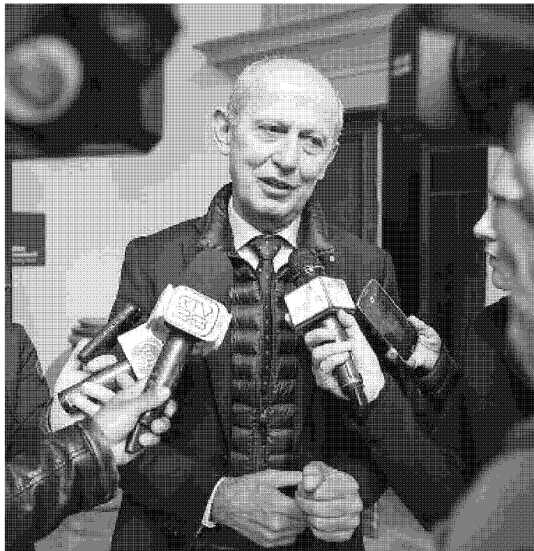
IN MISSIONE L'assessore regionale al turismo Stefano Ciuoffo