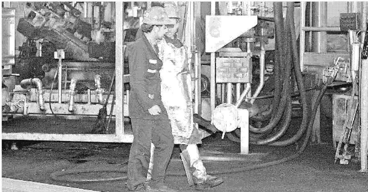
PIANO IN STALLO Operai all'interno dello stabilimento della Kme. L'azienda punta al pirogassificatore