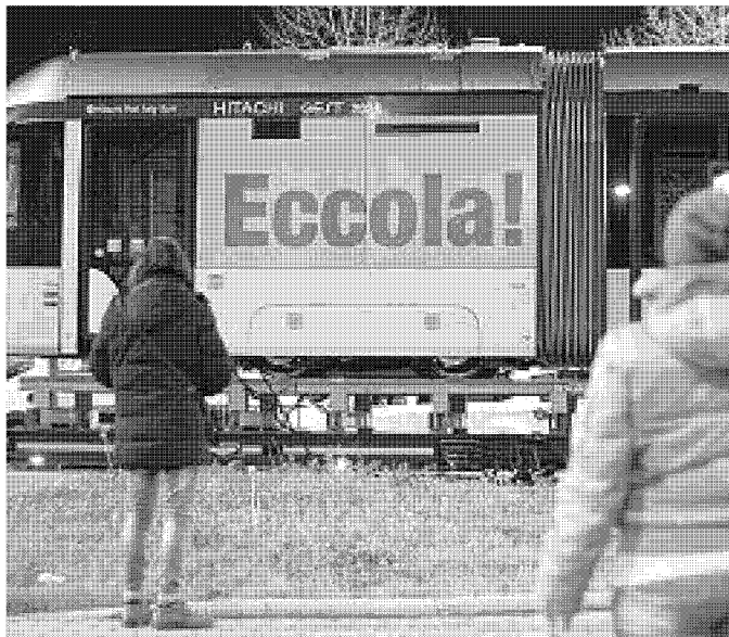
Dopo il trasporto notturno a inizio febbraio della tramvia per la Linea 3, ieri notte è stata la volta del primo convoglio sulla Linea 2