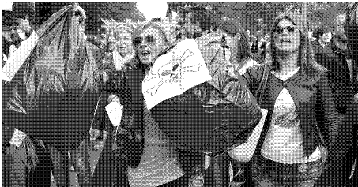
LA PROTESTA I cittadini temono ricadute ambientali e anche sulla loro salute. Chiedono certezze