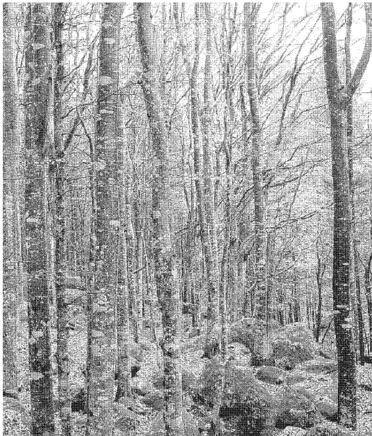
Il verde Con la nuova legge a rischio i boschi Ansa