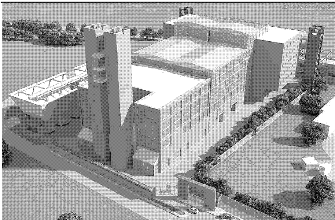
Il rendering Così dovrebbe essere il nuovo impianto di termovalorizzazione di Case Passerini