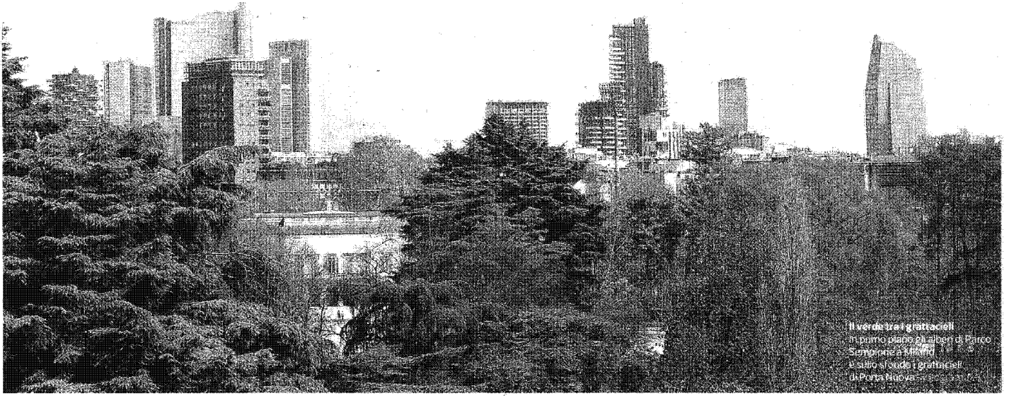
Il verde tra i grattacieli In primo piano gli alberi di Parco Sempione a Milano D'altro si vede i grattacieli di Porta Nuova