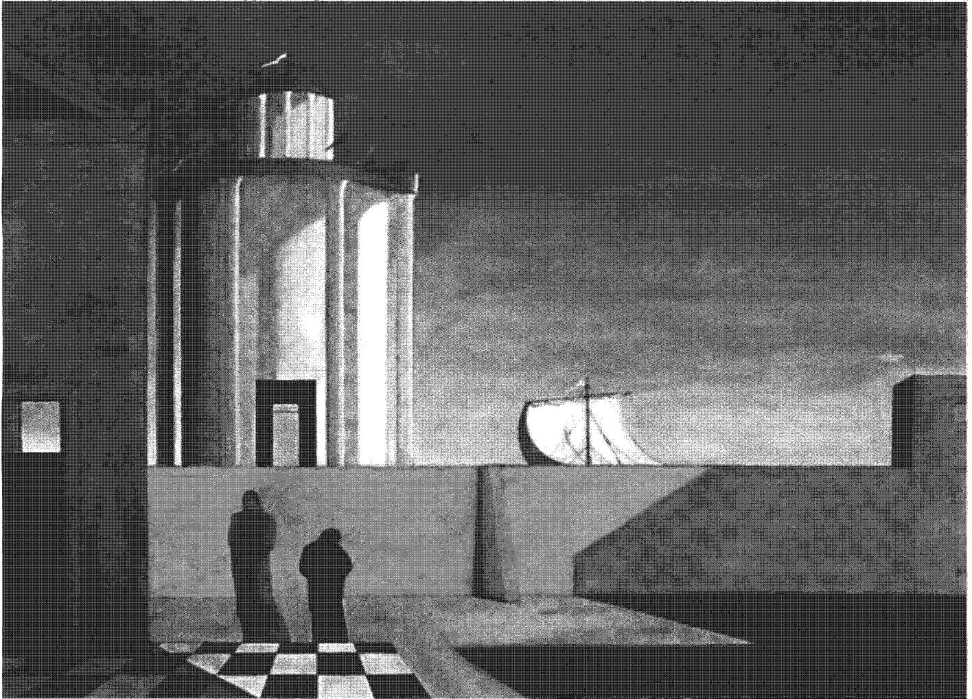
«L'enigma dell'arrivo e del pomeriggio» Giorgio de Chirico, 1911-1912