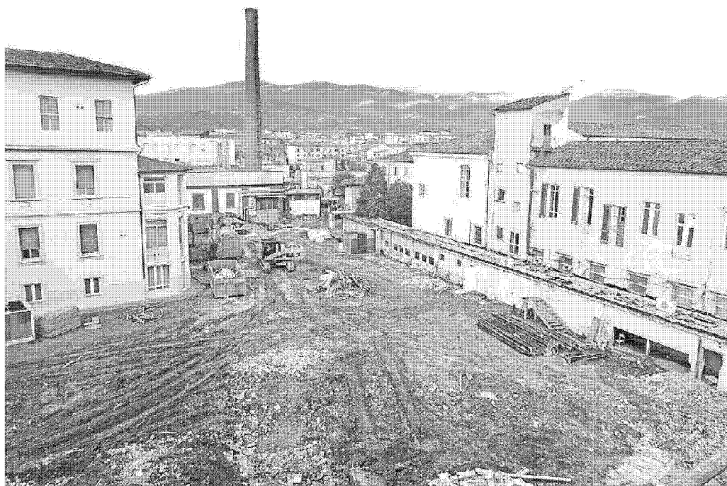
Il grande spiazzo già ricavato nella zona centrale dell'ex ospedale del Ceppo

Le ultime polemiche sul recupero dell'area dell'ex ospedale del Ceppo sono nate dopo che il Tirreno ha parlato del concorso internazionale di progettazione che il Comune lancerà sulle opere di urbanizzazione e sulla parte storica dell'ex ospedale del Ceppo. Cioè tutto ciò che è di proprietà del Comune. L'accordo di programma tra Comune, Asl e Regione (2015) prevede per la parte storica dell'ospedale una destinazione a museo (già in parte realizzata) e Casa della città; per la parte più moderna (su viale Matteotti) funzioni sanitarie; nel mezzo la realizzazione di alloggi, uffici e negozi, per un valore complessivo che dovrebbe consentire all'Asl di ricavarne 18 milioni.