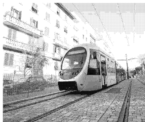
Il braccio di ferro tra ditte e Comune sembra risolto: la linea 3 della tramvia sarà in funzione a giugno, la 2 a fine agosto