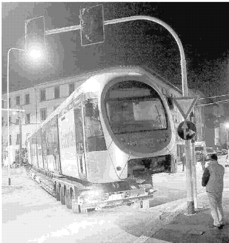
Lo sbarco dei vagoni Sirio della linea 3 è avvenuto nella notte in viale Morgagni davanti a una piccola folla di curiosi