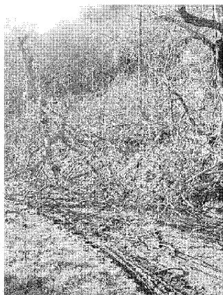
Il sentiero da ripulire

La pulizia del percorso cittadino tra il parco Il Piano e il paese è stata resa possibile dall'arrivo di 111mila euro a fondo perduto per il Piano di Sviluppo Rurale. Il Comune aveva infatti realizzato un progetto di riqualificazione dissesti e prevenzione incendi: con i fondi si sta pulendo l'antica via ormai invasa dai