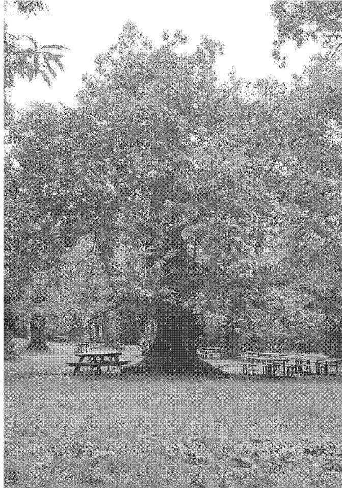
Uno scorcio del parco Il Piano

serva Cornate e Fosini era gestita dalla Provincia di Grosseto ma con il passaggio delle funzioni dalle province alle Regioni sono venuti meno i presupposti per un servizio continuativo. Così la vecchia "Casa Gerfalco" – ovvero la ex scuola di proprietà del comune di Montieri adibita ad info point – completamente rin-