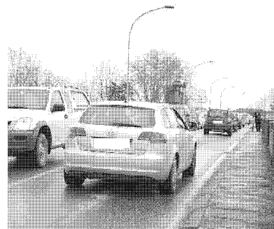
FUTURO Il ponte di Monte S. Quirico. Quando quello nuovo?

all'Anas - spiega Ceccarelli - noi abbiamo fatto quanto dovuto, ovvero abbiamo pensato a tirare fuori i soldi. Entro giugno, comunque, Anas dovrebbe produrre il progetto esecutivo per gli assi Nord-Sud e dunque a quel punto potremmo procedere». Diversa e