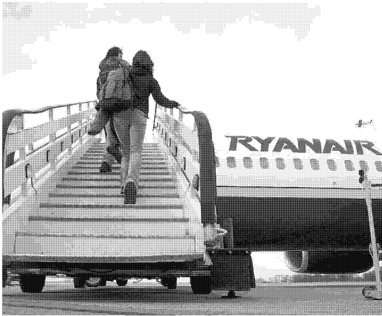
Record di passeggeri negli aeroporti toscani nel 2017