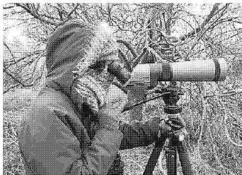
Sopra, un'ornitologa osserva volatili A destra, un piro piro piccolo